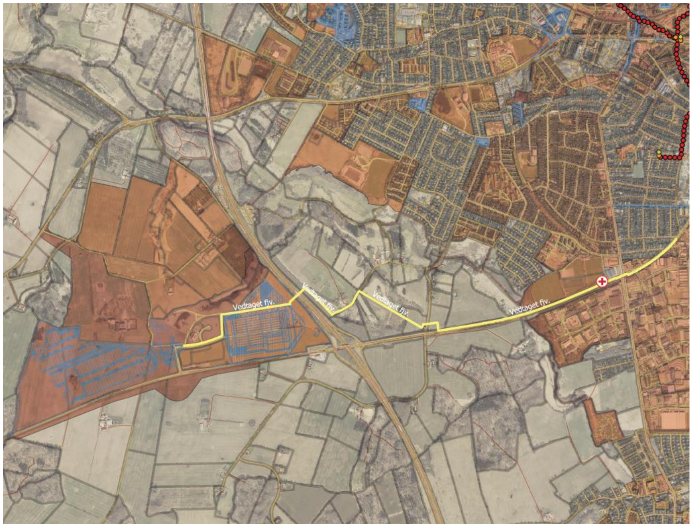
Kort 1. Afgrænsningen af projektet 'Fjernvarme Tankedalsvej' med angivelse af hovedledningens formodede forløb.